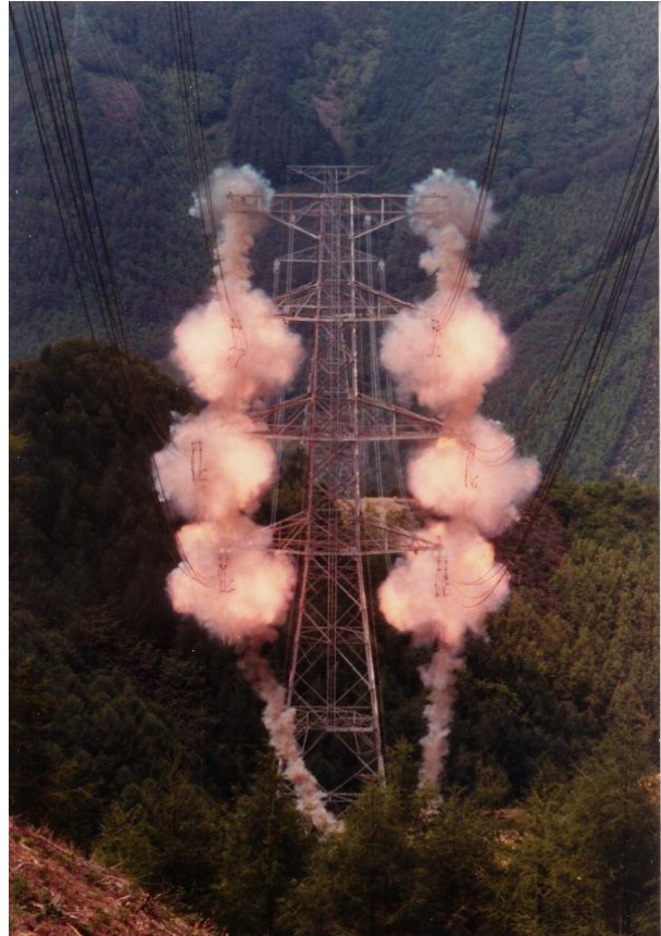
Muffenmontage in Japan